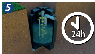
5. Com a tampa lacrada, encher o Multibiodigestor com água por meio da tubulação de saída até retornar a água pela própria tubulação, garantindo assim que o filtro não sofra pressão ascendente. Após efetuado esse processo, preencher o corpo do Multibiodigestor por meio da tubulação de entrada, observando que o registro de remoção de lodo esteja fechado. Deixar o sistema em repouso por 24 horas para assegurar que a estanqueidade do equipamento tenha sido preservada.