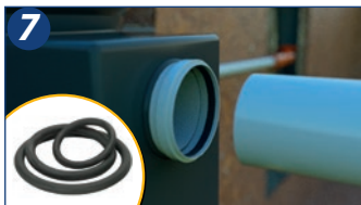
7. Utilizar anéis de vedação para realizar as conexões de entrada e saída do efluente (que deverá ser direcionado a um sumidouro, vala de infiltração ou rede coletora). Instalar a tubulação e o registro de remoção do lodo. Manter o registro fechado.