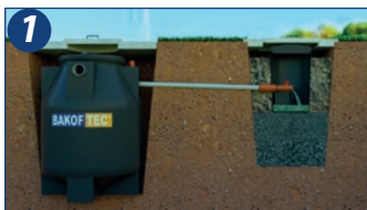
1. O Multi Biodigestor Bakof Tec deve ser instalado enterrado.