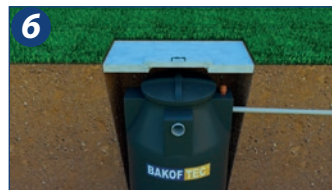
6. Caso o sistema seja totalmente enterrado ou instalado em local de intensa circulação (ou circulação de veículos), deve-se construir uma laje de sustentação que não seja apoiada no equipamento, além de manter fácil acesso à sua tampa de inspeção para eventual manutenção e limpeza do equipamento, cuja periodicidade deve ser a cada 12 meses, ou inferior conforme necessidade.