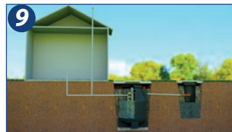
9. O tratamento anaeróbio é natural e inerente a formação de gases. O responsável pela instalação hidráulica da residência deverá construir a tubulação de forma a conduzir para o sistema de ventilação do esgoto sanitário os gases, utilizando as técnicas necessárias.

Siga corretamente as instruções de instalação e operação dos produtos BAKOF TEC.