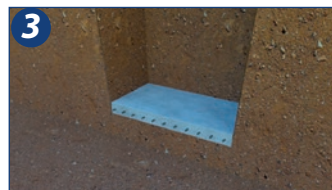
3. Construir uma base nivelada e lisa em concreto armado que servirá como apoio para o Multi Biodigestor.