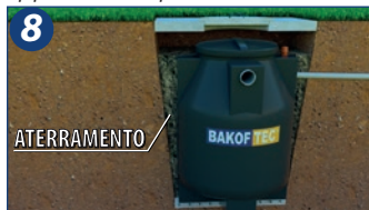
8. Realizar o aterramento lateral do equipamento utilizando terra (livre de pedras ou objetos pontiagudos), areia ou pó de brita adicionadas a cimento com traço de 1:10 (uma parte de cimento para 10 partes de areia) e efetuar a compactação a cada 25 cm. Não devem ser utilizadas máquinas para aterramento.